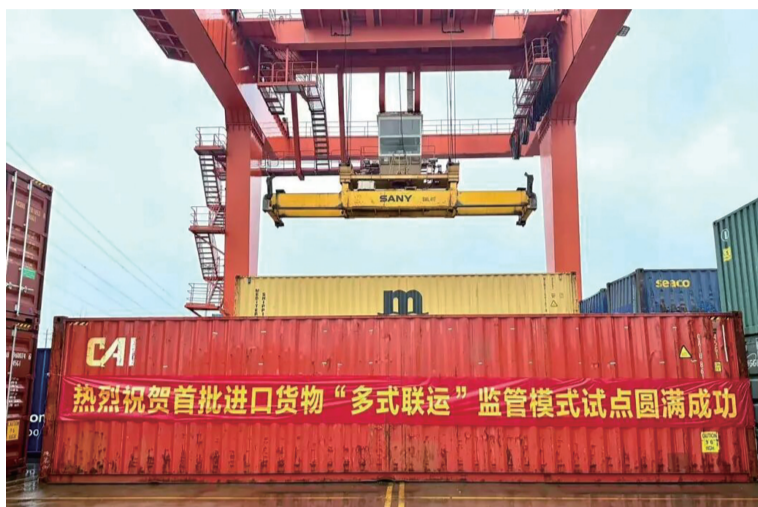
首批进口货物落地东洲港

本报讯(通讯员 孙哲洋 记者 徐康亮)今年1月,海关总署在全国启动首批海铁、水水多式联运“一单制”监管模式试点,杭州东洲内河国际港有限公司(以下简称“东洲港”)凭借区位优势,成为杭州市首家试点单位。近日,首批进口货物落地东洲港,标志着杭州地区外贸物流通关运输效率迎来实质性跃升。