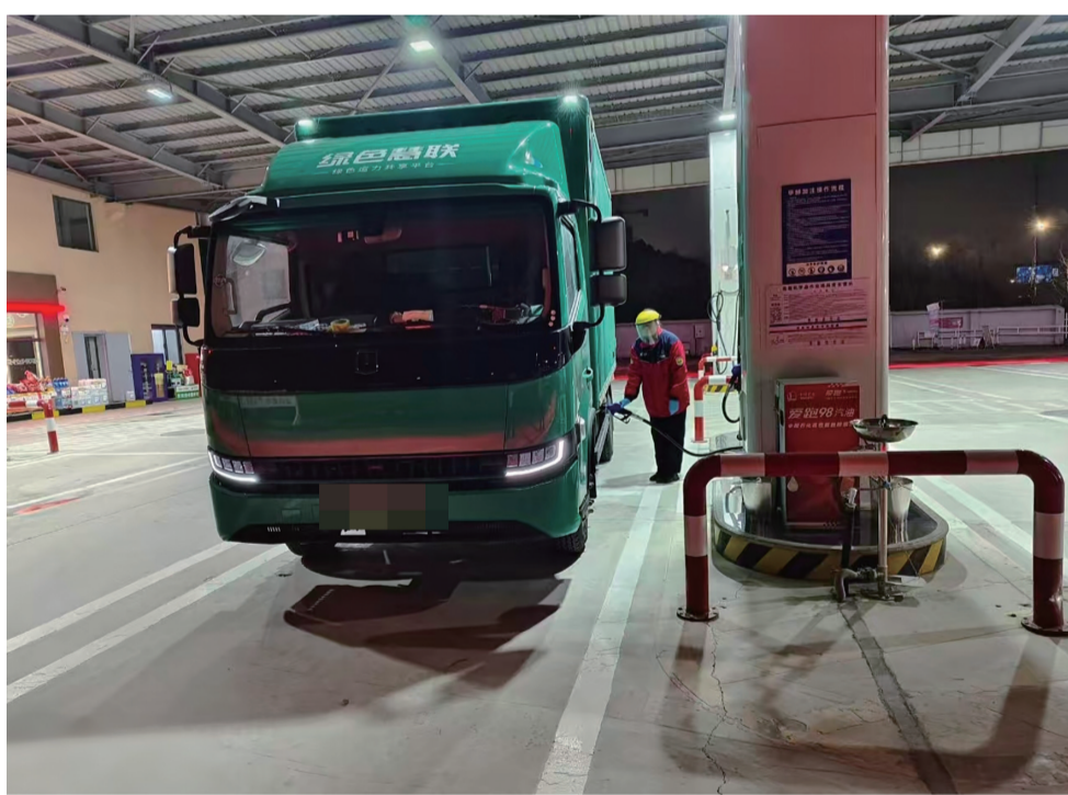
富阳春南加能站完成首次甲醇燃油加注

此前,由中国石化浙江分公司和浙江高速石油合资建设的萧山坎山加能站已投用甲醇加注设施,为沪杭甬、杭金衢高速上的长途货车提供服务。如今,富阳春南加能站成为杭州城区范围内首座甲醇加注站。