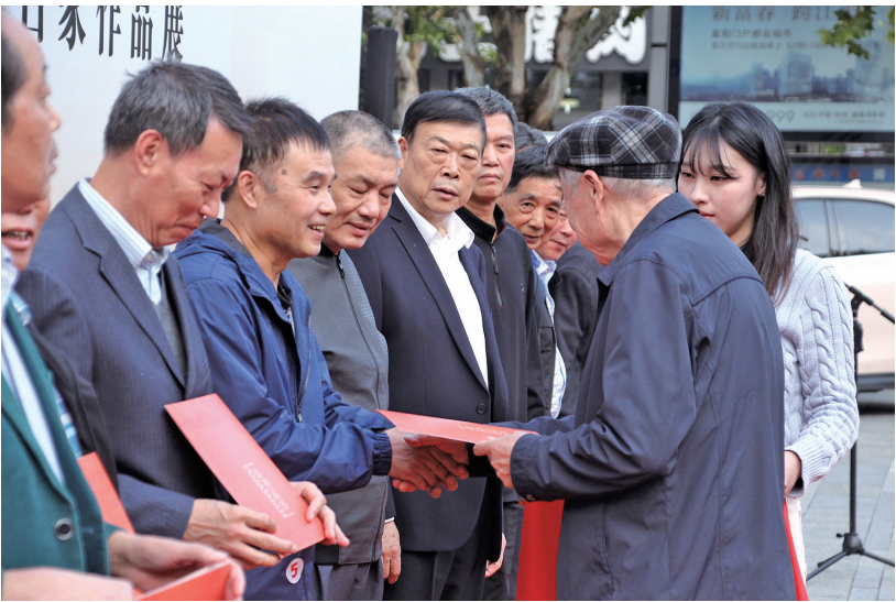
为获奖老人颁发证书