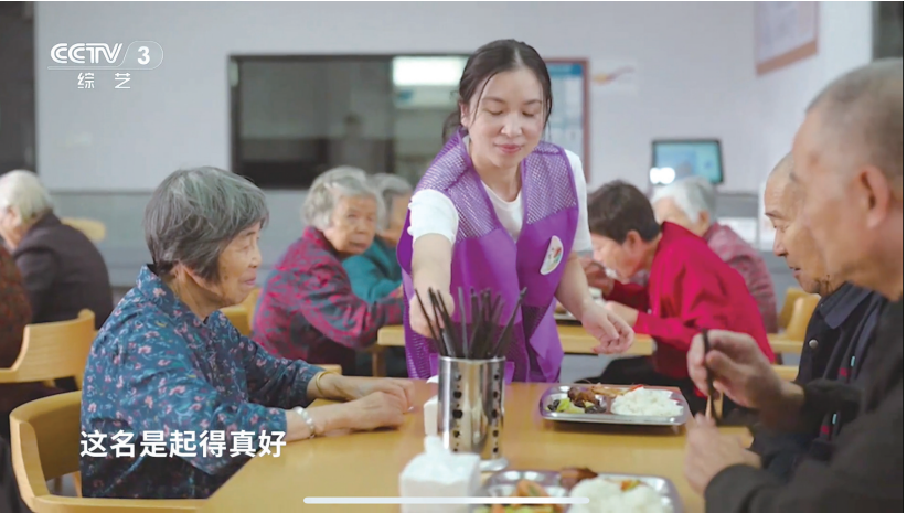
八一村老年食堂(节目截图)

就在主持人和唐国强体验完市集,准备离开之际,遇上了正在八一村共享中心广场上欢快起舞的老年舞蹈团。他们迅速融入其中,与八一村的“姐姐们”一起跳起了健身操,在《青春修炼手册》歌曲的伴奏下,现场笑声不断,化作一片青春洋溢的海洋。