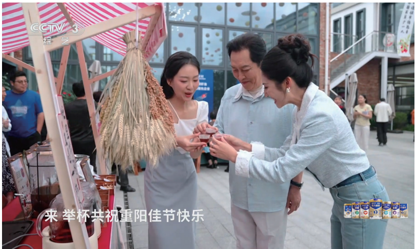
唐国强品尝富阳特色小吃(节目截图)

随着“霞光号”的银发专列,主持人苏眉文、刘璇与特别嘉宾唐国强来到了位于富阳春江街道的八一村,与观众共同感受这个“全国示范性老年友好型社区”里的温情与活力。