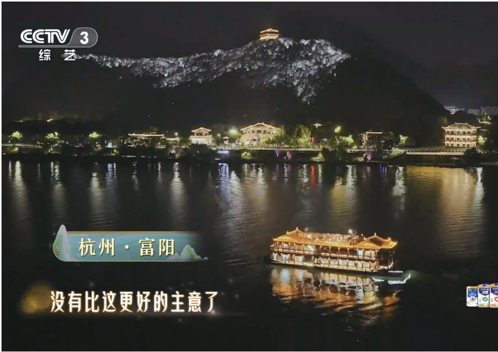
央视重阳特别节目

10月29日重阳节当晚,中央广播电视总台2025重阳特别节目《霞光满天山河颂》正式播出,富阳作为本次节目分会场之一,为观众带来多个节目的精彩演绎。通过5对富阳抗美援朝志愿军老兵的故事、知名艺术家杨洪基的演绎,以及著名演员唐国强的视角,富阳生动展现了“现代版富春山居图”里,老年人们的幸福生活与动人故事。