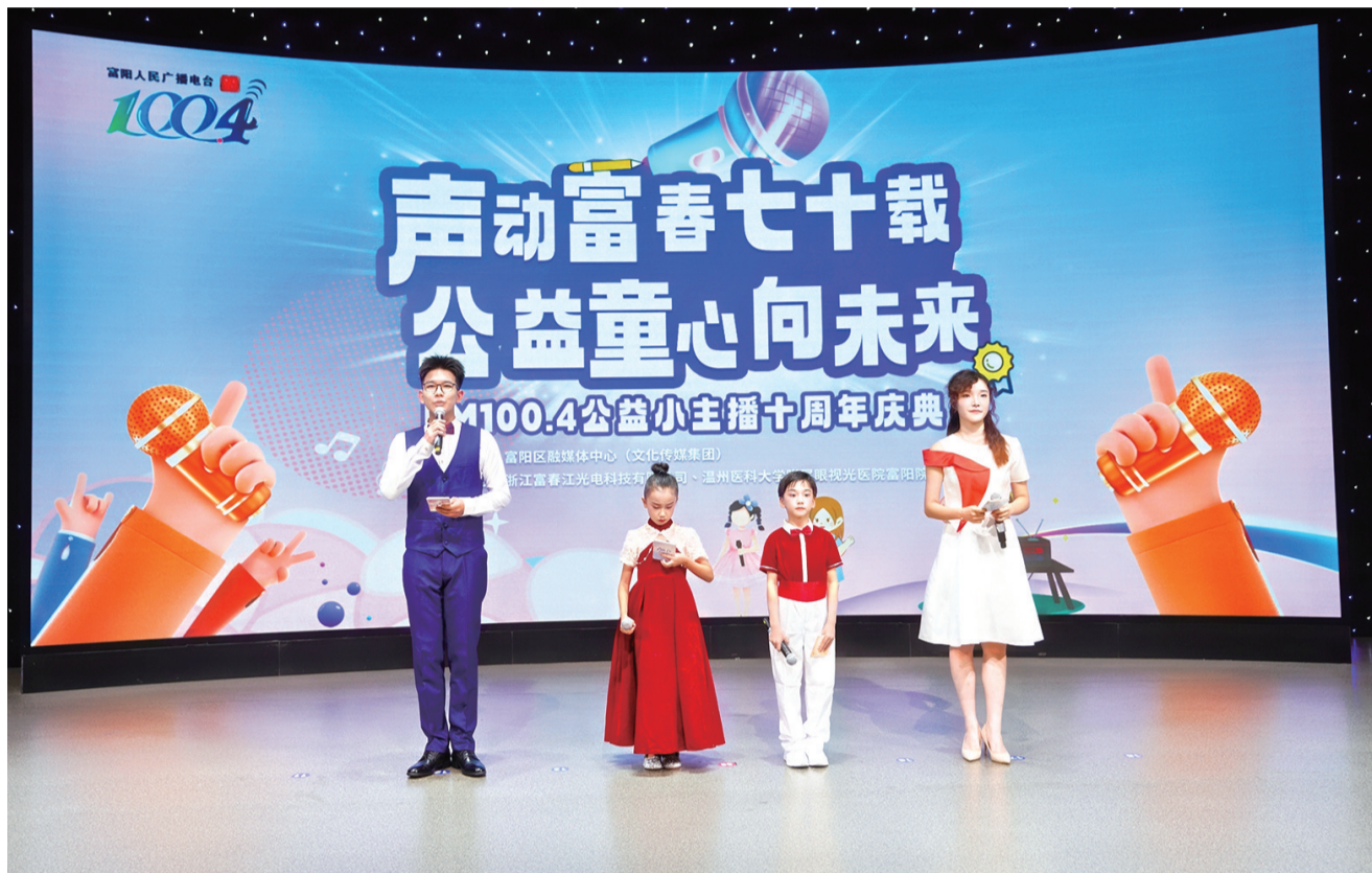
FM100.4公益小主播十周年活动现场

9月6日下午，“声动富春七十载、公益童心向未来”FM100.4公益小主播十周年活动，在富阳区融媒体中心演播室举行。本次活动以富阳人民广播电台七十周年为核心主题，精心设置《童心筑梦》《薪火相传》《声动未来》三个篇章，通过歌舞表演、人物访谈、诗歌朗诵等丰富形式，深情回溯了富阳人民广播电台七十载的奋斗征程，既充满回忆感，又兼具创意性。