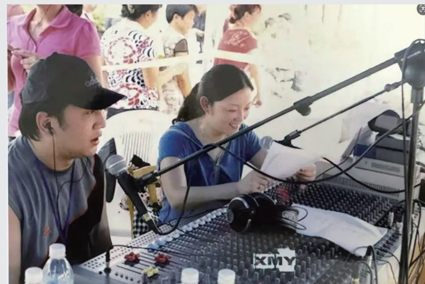
主播在户外现场直播富阳第一届自行车赛(摄于2005年)