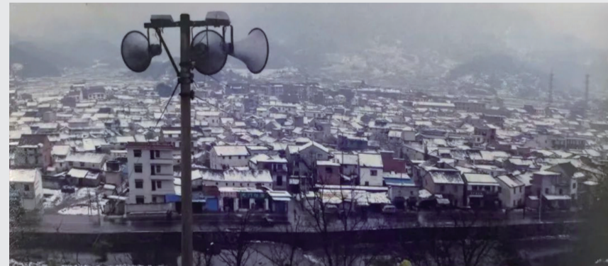
农村的高音喇叭(摄于上世纪80年代)