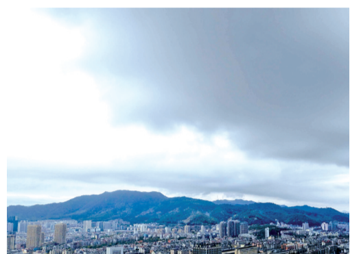
富阳城区阴云密布

本报讯(记者 孙莹)昨天全省都笼罩在阴雨之中,雨雾锁城,不少地方都呈现出了一幅“江南水墨画”的景象,也有部分地区出现了中到大雨甚至雷雨天气。今天随着切变系统的不断南压至移出,雨水会明显减弱,今天夜里起全省范围内雨水将自北向南雨止。但是雨水只是在今天短暂地休息一下,因为一个低涡系统(低涡是大气中的低压“小漩涡”,当它卷入大量水汽时,所到之处就会出现降水)正在滚滚而来,明天起到本周末富阳还是有较为明显的降雨过程。沉闷的阴雨天从本周末起会被阳光驱散,目前看来下周都是晴朗的好天哦!