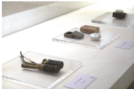
郁达夫用过的铜烟筒