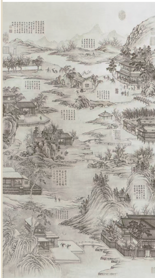
董邦达《九阳消寒图》轴。宣德笺本，设色，纵116.2厘米，横69.3厘米，款署：畧董邦达恭绘。