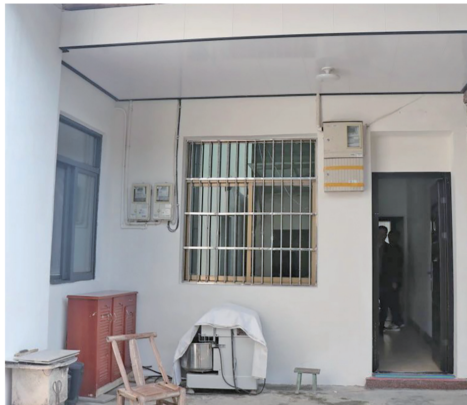
老章家的老屋修缮一新

在富阳,像老章这样得到关爱的退役老兵还有很多,政府部门和相关协会正持续努力,制定了针对退役老兵们的长期关怀计划,包括定期探访、法律援助等,让每一位老兵都能安享晚年,让他们心中永远充满温暖与希望。